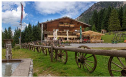
Foto rechts: Die Vilser Alm liegt in der Nähe bzw. oberhalb vom Vilser Steinbruch