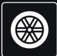
REIFEN & FELGEN