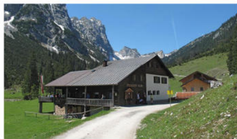
Foto links: Die Musauer Alm liegt am Eingang zum Raintal unterhalb der felsigen und eindrucksvollen Nordabstürze der Gehrenspitze.

Charakter: Mittelschwere Wanderung, die sehr gute Kondition, Ausdauer Trittsicherheit, sowie ein Mindestmaß an Schwindelfreiheit erfordert. Die Teilnehmer müssen in der Lage sein auch mal bis zu 1000 Höhenmeter bergauf oder bergab am Tag zu gehen. Die Teilnahme erfolgt auf eigenes Risiko !!!